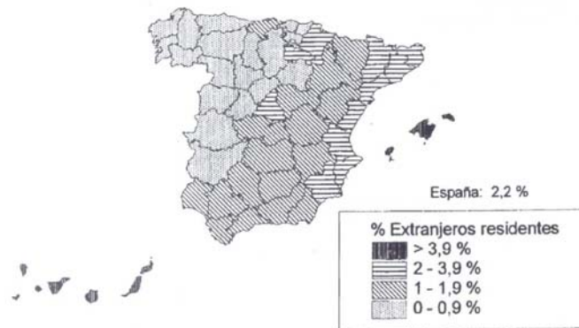
Porcentaje de extranjeros residentes respecto a la población residente.

1.2.A la vista del mapa adjunto, el “Porcentaje de extranjeros residentes 2000”, indique las provincias con índice iguales o superiores al 2% así como las principales razones que explican esa localización.